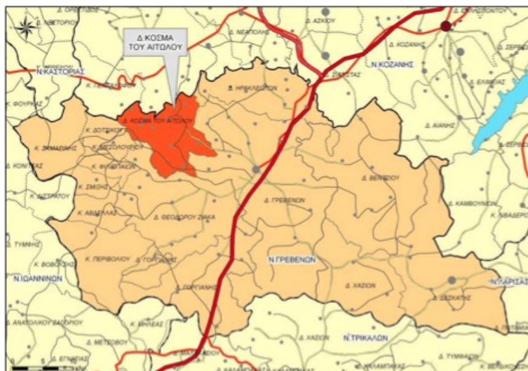
Χάρτης 6: Χωροταξική ένταξη Δ.Ε Αγίου Κοσμά στο Ν. Γρεβενών

Η Δημοτική Ενότητα Αγίου Κοσμά βρίσκεται στο βορειοδυτικό τμήμα του Νομού Γρεβενών και συνορεύει δυτικά με τις Δ.Ε Δοτσικού και Μεσολουρίου, νοτιοδυτικά με τη Δ.Ε Θεόδωρου Ζιάκα, ανατολικά με τη Δ.Ε Γρεβενών, βορειοανατολικά με τη Δ.Ε Ηρακλεωτών και βόρεια με το Νομό Κοζάνης. Η έκταση της Δημοτικής Ενότητας Αγίου Κοσμά είναι περίπου 115.093 στρ. και έδρα του είναι ο οικισμός Μέγαρον που συγκεντρώνει το 42,52% του συνολικού πληθυσμού. Γεωμορφολογικά, στην περιοχή κυριαρχούν οι ορεινές εκτάσεις που σε συνδυασμό με τα λιγοστές καλλιεργήσιμες εκτάσεις οδήγησαν στην ανάπτυξη της κτηνοτροφίας.