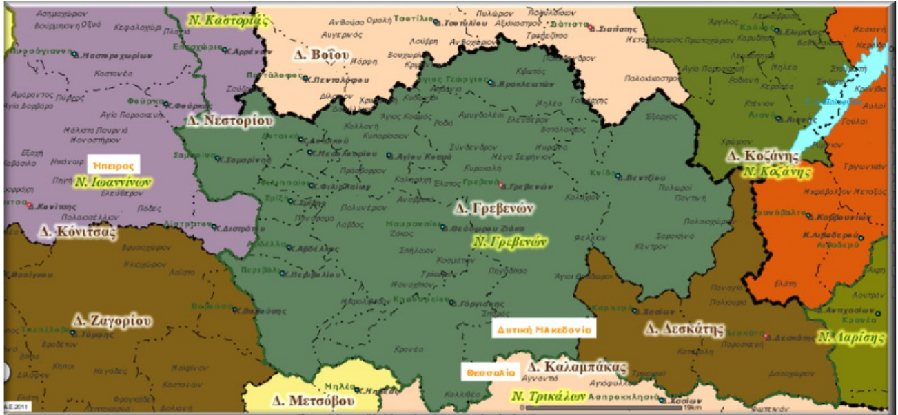
Σχήμα 1.1 Τα γεωγραφικά όρια του «Καλλικρατικού» Δήμου Γρεβενών

Ο Δήμος Γρεβενών ανήκει στην περιφερειακή ενότητα Γρεβενών της περιφέρειας Δυτικής Μακεδονίας, έχει έκταση 1859,23τ.χλμ, πραγματικό 26.399 (δηλ. όσοι απογράφηκαν στο Δήμο Γρεβενών την ημέρα της απογραφής) και μόνιμο πληθυσμό 25.905 κατοίκους σύμφωνα με τα στοιχεία της ΕΛ.ΣΤΑΤ από την απογραφή του 2011, ενώ σύμφωνα με την απογραφή του 2001 ο πληθυσμός ήταν 30.542 κάτοικοι.