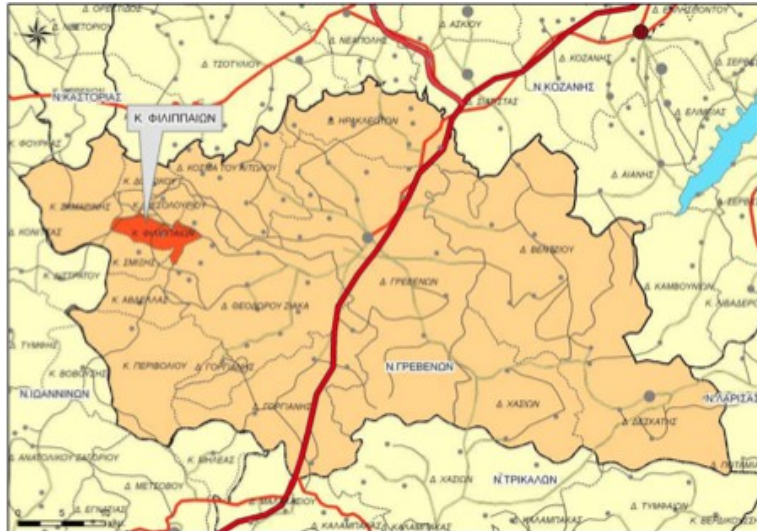
Χάρτης 13: Χωροταξική ένταξη Δ.Ε Φιλιππαιών στο Ν. Γρεβενών

Μελετώντας τη διοικητική αναδιάρθρωση της πρώην Κοινότητας Φιλιππαιών, διαπιστώνεται ότι αρχικά συστάθηκε ως τμήμα του Νομού Κοζάνης (ΦΕΚ 260Α - 31/12/1918) με έδρα τον οικισμό Φιλιππαίοι και τον οικισμό Τσουργιακάτ να προσαρτάται στην Κοινότητα. Ο τελευταίος μετονομάζεται σε Τσιούργιακας με το ΦΕΚ 229Α - 17/10/1919, ενώ με το ΦΕΚ 18Α - 01/02/1927 μετονομάζεται ξανά σε Αετιά. Το 1964 με το ΦΕΚ 185Α - 30/10/1964 η Κοινότητα υπάγεται στο Νομό Γρεβενών. Το 1971 αναγνωρίζεται ο οικισμός Κουρούνα και προσαρτάται στην Κοινότητα (ΦΕΚ - 14/03/1971). Σύμφωνα με τον Ν.3852/2010 (ΦΕΚ 87/07-7-2010) «Νέα Αρχιτεκτονική της Αυτοδιοίκησης και της Αποκεντρωμένης Διοίκησης – Πρόγραμμα Καλλικράτης», η πρώην κοινότητα Φιλιππαιών συγκροτείται πλέον σε Δημοτική Ενότητα (Δ.Ε) Φιλιππαιών του Καλλικρατικού Δήμου Γρεβενών, η οποία αποτελείται από την Τοπική Κοινότητα Φιλιππαιών.