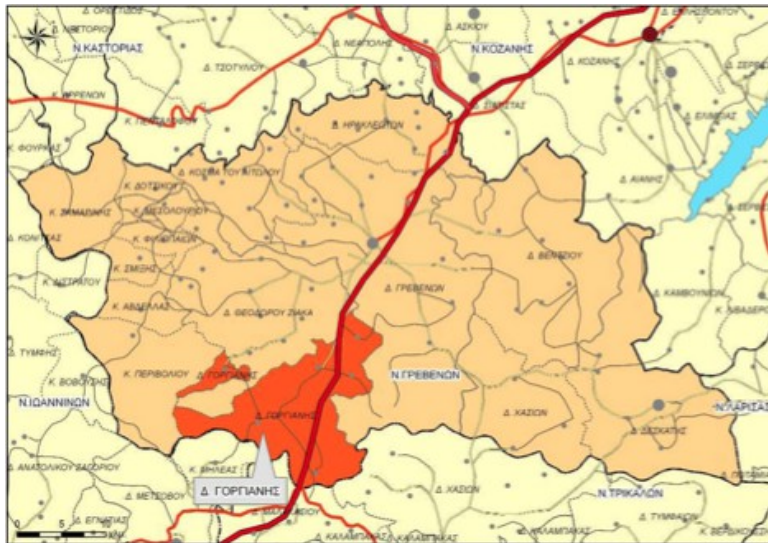
Χάρτης 3: Χωροταξική ένταξη Δ.Ε Γόργιανης στο Ν. Γρεβενών

Ο πρώην Δήμος Γόργιανης συστάθηκε το 1997 με το ΦΕΚ 244Α - 04/12/1997 με την απόσπαση του οικισμού Κηπουρείο από την Κοινότητα Κηπουρείου και τον ορισμό του ως έδρα του Δήμου. Επίσης, με το ίδιο ΦΕΚ, καταργούνται και συνενώνονται με αυτόν οι Κοινότητες Πηγαδίτσης, Κρανέας, Σιταρά, Κηπουρείου, Καλλιθέας και Μικρολιβάδου. Σύμφωνα με τον Ν.3852/2010 (ΦΕΚ 87/07-7-2010) «Νέα Αρχιτεκτονική της Αυτοδιοίκησης και της Αποκεντρωμένης Διοίκησης – Πρόγραμμα Καλλικράτης», ο πρώην Δήμος Γοργιανής συγκροτείται πλέον σε Δημοτική Ενότητα (Δ.Ε) Γοργιανής του Καλλικρατικού Δήμου Γρεβενών, η οποία αποτελείται από τις ακόλουθες 6 Τοπικές Κοινότητες : Καλλιθέας, Κηπουρείου, Κρανέας, Μικρολιβάδου, Πηγαδίτσης, Σιταρά.