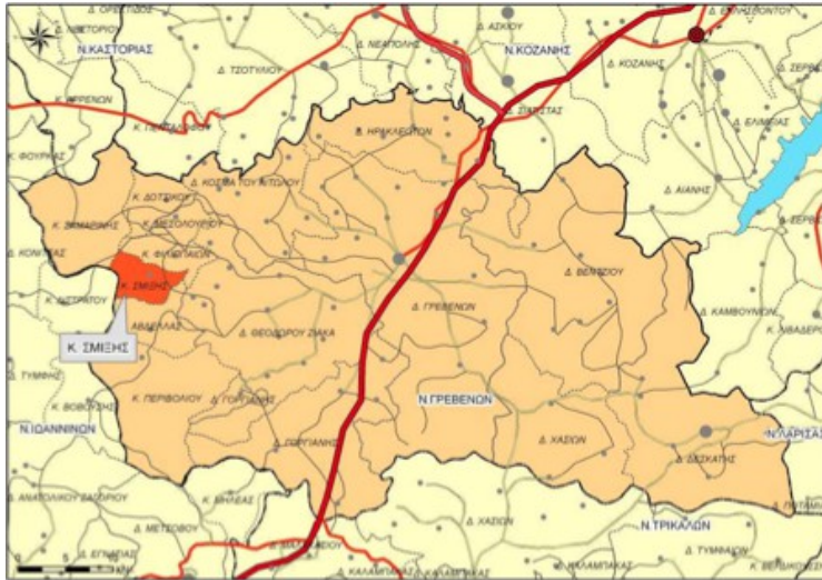
Χάρτης 12: Χωροταξική ένταξη Δ.Ε Σμίξης στο Ν. Γρεβενών

Η Δημοτική Ενότητα Σμίξης βρίσκεται στο δυτικό τμήμα του Νομού Γρεβενών και συνορεύει δυτικά με το Νομό Ιωαννίνων, νότια και ανατολικά με τη Δ.Ε Αβδέλλας, βόρεια με τη Δ.Ε Φιλιππαιών και βορειοδυτικά με τη Δ.Ε Σαμαρίνας. Η έκταση της Κοινότητας είναι περίπου 24.951 στρ. και έδρα της είναι η Σμίξη που συγκεντρώνει το σύνολο του πληθυσμού. Δυτικά της Σμίξης υψώνεται η Βασιλίτσα (2.249 μ.) στην κορυφή της οποίας έχει διαμορφωθεί πίστα για σκι. Απέναντι από την κορυφή της Βασιλίτσας βρίσκεται η κορυφή «Γομάρα» (2.126 μ.), με διάσπαρτα γέρικα ρόμππολα και μαυρόπευκα. Στα όρια Σμίξης - Φιλιππαιών - Σαμαρίνας βρίσκεται η κορυφή Σταυρός (1.560 μ.), ενώ στα όρια Σμίξης-Φιλιππαιών η κορυφή Προφήτης Ηλίας (1.138 μ.).