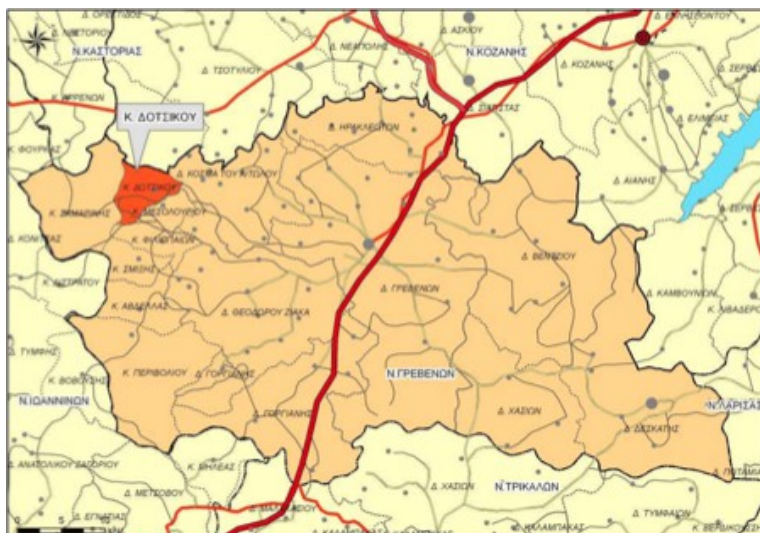
Χάρτης 8: Χωροταξική ένταξη Δ.Ε Δοτσικού στο Ν. Γρεβενών

Σύμφωνα με τον Ν.3852/2010 (ΦΕΚ 87/07-7-2010) «Νέα Αρχιτεκτονική της Αυτοδιοίκησης και της Αποκεντρωμένης Διοίκησης – Πρόγραμμα Καλλικράτης», η πρώην κοινότητα Δοτσικού συγκροτείται πλέον σε Δημοτική Ενότητα (Δ.Ε) Δοτσικού του Καλλικρατικού Δήμου Γρεβενών, η οποία αποτελείται από την Τοπική Κοινότητα Δοτσικού.