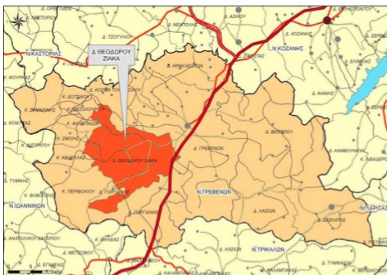
Χάρτης 5: Χωροταξική ένταξη Δ.Ε Θεόδωρου Ζιάκα στο Ν. Γρεβενών

Ο πρώην Δήμος Θεόδωρου Ζιάκα συστάθηκε το 1997 (ΦΕΚ 244Α - 04/12/1997) με την απόσπαση του οικισμού Μαυραναίοι από την Κοινότητα Μαυραναίων και τον ορισμό του ως έδρα του Δήμου. Επίσης, με το ίδιο ΦΕΚ, καταργούνται και συνενώνονται με το Δήμο οι Κοινότητες Τρικώμου, Ζάκα, Μοναχίτιου, Πανοράματος, Αναβρυτών, Αλατόπετρας, Μαυραναίων, Πολυνερίου, Προσβόρρου, Σπηλαίου, Κοσματίου και Λάβδα. Σύμφωνα με τον Ν.3852/2010 (ΦΕΚ 87/07-7-2010) «Νέα Αρχιτεκτονική της Αυτοδιοίκησης και της Αποκεντρωμένης Διοίκησης – Πρόγραμμα Καλλικράτης», ο πρώην Δήμος Θεόδωρου Ζιάκα συγκροτείται πλέον σε Δημοτική Ενότητα (Δ.Ε) Θεόδωρου Ζιάκα του Καλλικρατικού Δήμου Γρεβενών, η οποία αποτελείται από τις ακόλουθες 12 Τοπικές Κοινότητες : Αλατόπετρας, Αναβρυτών, Ζάκα, Κοσματίου, Λάβδα, Μαυραναίων, Μοναχίτιου, Πανοράματος, Πολυνερίου, Προσβόρρου, Σπηλαίου, Τρικώμου.