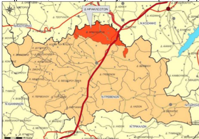
Χάρτης 4: Χωροταξική ένταξη Δ.Ε Ηρακλειωτών στο Ν. Γρεβενών

Ο πρώην Δήμος Ηρακλεωτών συστάθηκε το 1997 (ΦΕΚ 244Α - 04/12/1997) με την απόσπαση του οικισμού Άγιος Γεώργιος από την Κοινότητα Αγίου Γεωργίου και τον ορισμό του ως έδρα του Δήμου. Επίσης, με το ίδιο ΦΕΚ, καταργούνται και συνενώνονται με το Δήμο οι Κοινότητες Κιβωτού, Κληματακίου, Κοκκινιάς, Μηλέας, Ταξιάρχου, Αηδονίων, Πολυδένδρου και Αγίου Γεωργίου. Σύμφωνα με τον Ν.3852/2010 (ΦΕΚ 87/07-7-2010) «Νέα Αρχιτεκτονική της Αυτοδιοίκησης και της Αποκεντρωμένης Διοίκησης – Πρόγραμμα Καλλικράτης», ο πρώην Δήμος Ηρακλειωτών συγκροτείται πλέον σε Δημοτική Ενότητα (Δ.Ε) Ηρακλειωτών του Καλλικρατικού Δήμου Γρεβενών, η οποία αποτελείται από τις ακόλουθες 8 Τοπικές Κοινότητες : Αγίου Γεωργίου , Αηδονίων, Κιβωτού, Κληματακίου, Κοκκινιάς, Μηλέας, Πολυδένδρου, Ταξιάρχη.