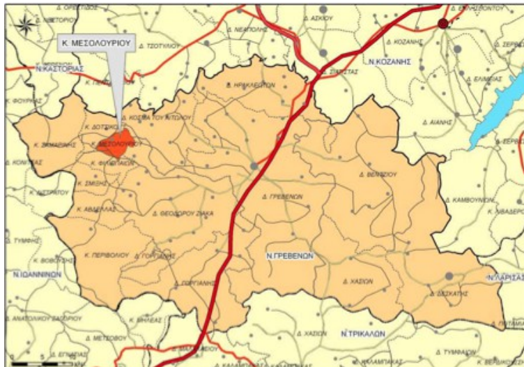
Χάρτης 9: Χωροταξική ένταξη Δ.Ε Μεσολοιρίου στο Ν. Γρεβενών

Η Δημοτική Ενότητα Μεσολοιρίου βρίσκεται στο βορειοδυτικό τμήμα του Νομού Γρεβενών και συνορεύει βορειοδυτικά με τη Δ.Ε Δοτσικού, νοτιοδυτικά με τη Δ.Ε Φιλιππαιών, νοτιοανατολικά με τη Δ.Ε Θεόδωρου Ζιάκα και βορειοανατολικά με τη Δ.Ε Αγίου Κοσμά. Η έκταση της Δ.Ε. Μεσολοιρίου είναι περίπου 17.821 στρ. και η έδρα της είναι το Μεσολούρι (ο μοναδικός οικισμός της Δ.Ε.) που συγκεντρώνει το σύνολο του πληθυσμού.