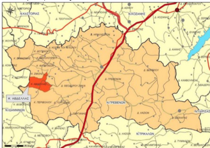
Χάρτης 7: Χωροταξική ένταξη Δ.Ε Αβδέλλας στο Ν. Γρεβενών

Από την ανάλυση της διοικητικής μεταβολής της Δημοτικής Ενότητας Αβδέλλας, προκύπτει ότι η εν λόγω πρώην Κοινότητα συστάθηκε το 1918 ως τμήμα του Νομού Κοζάνης με έδρα τον οικισμό Αβδέλα. Το 1928 με το ΦΕΚ - 16/05/1928 η ονομασία του οικισμού Αβδέλα της Κοινότητας διορθώνεται σε Αβδέλλα και αντιστοίχως μετονομάζεται και η Κοινότητα. Από το 1964 και μετά, με το ΦΕΚ 185Α - 30/10/1964 η Κοινότητα Αβδέλλας υπάγεται πλέον στο Νομό Γρεβενών. Σύμφωνα με τον Ν.3852/2010 (ΦΕΚ 87/07-7-2010) «Νέα Αρχιτεκτονική της Αυτοδιοίκησης και της Αποκεντρωμένης Διοίκησης – Πρόγραμμα Καλλικράτης», η πρώην κοινότητα Αβδέλλας συγκροτείται πλέον σε Δημοτική Ενότητα (Δ.Ε) Αβδέλλας του Καλλικρατικού Δήμου Γρεβενών, η οποία αποτελείται από την Τοπική Κοινότητα Αβδέλλας.